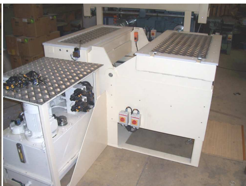
TABLE DE RETOURNEMENT ET DE HOUSSAGE MANUEL