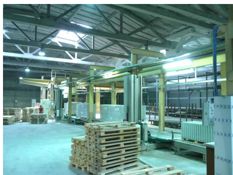
LIGNE DE DEPOSE SUR PALETTES