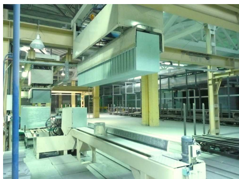
DEPOSE CARREAUX SUR BANC DE COMPRESSION